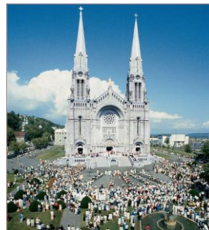
Sainte-Anne de Beaupré