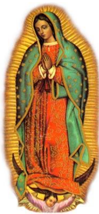
Notre Dame de Guadalupe