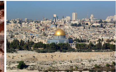
Jérusalem (vue du Mont des Oliviers)