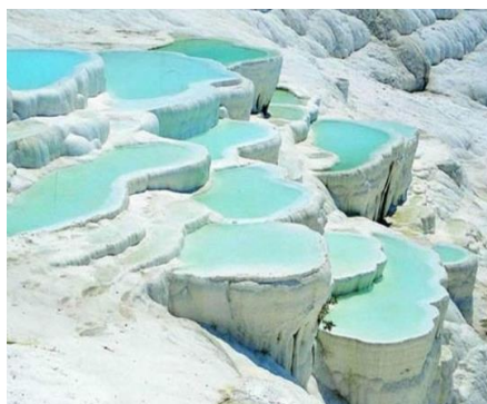
Châteaux de cotons